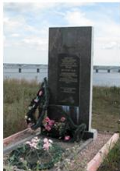
Памятник в Октябрьске

Учитывая все вышеизложенное, можно с большой долей уверенности говорить о том, что осенью 1942 года над Безенчуком пролетел именно самолет Ju-88D-1 с бортовым номером 1635, и произошло это 4 октября. Если так, то обстрелять советский эшелон вполне мог бортстрелок, находившийся в нижней гондоле «Юнкерса» и вооруженный пулеметом MG-15 (кал. 7,92 мм).