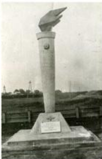
Памятник в Баклушах