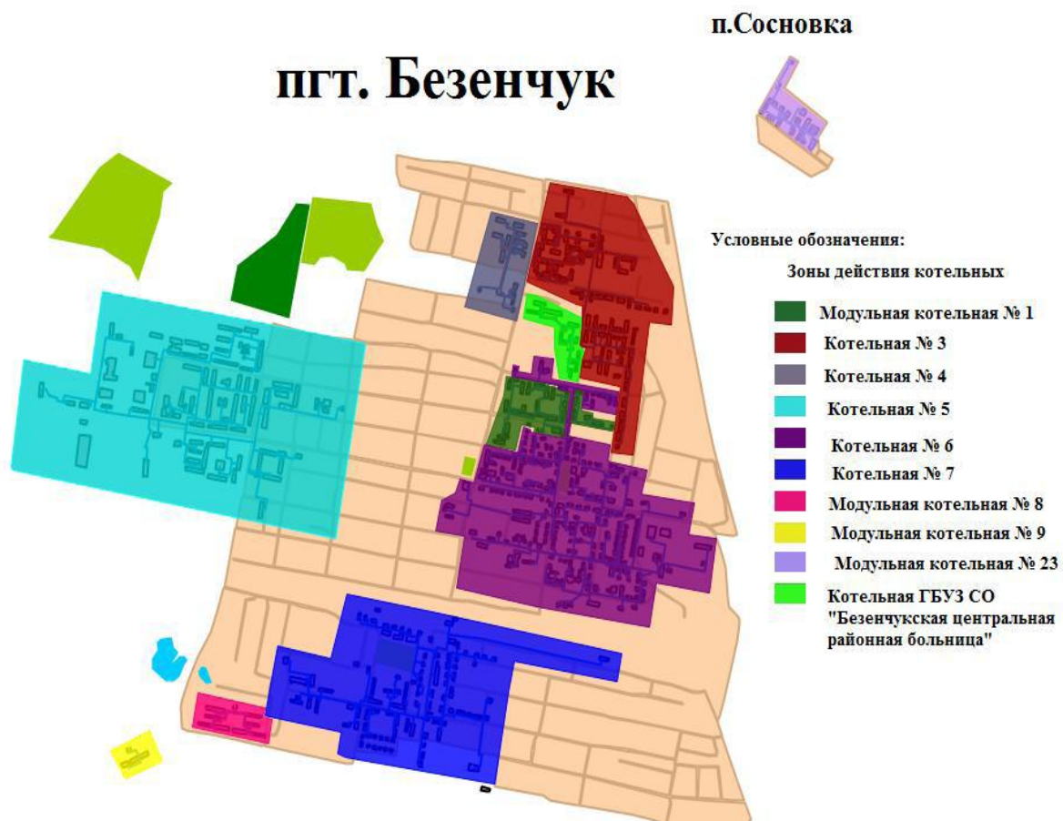
Рисунок 3 – Зоны действия автономной и централизованных котельных п.г.т. Безенчук и п. Сосновка