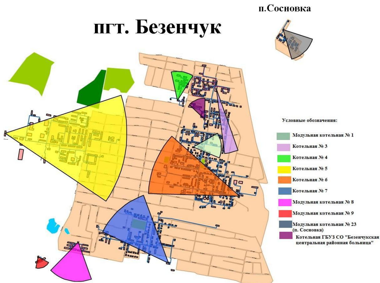
Рисунок 2 - Радиусы эффективного теплоснабжения от котельных г.п. Безенчук

Существующая жилая и социально-административная застройка поселения, подключенные к централизованному теплоснабжению, полностью находятся в пределах радиуса эффективного теплоснабжения, и подключение новых потребителей в границах сложившейся застройки экономически оправдано.