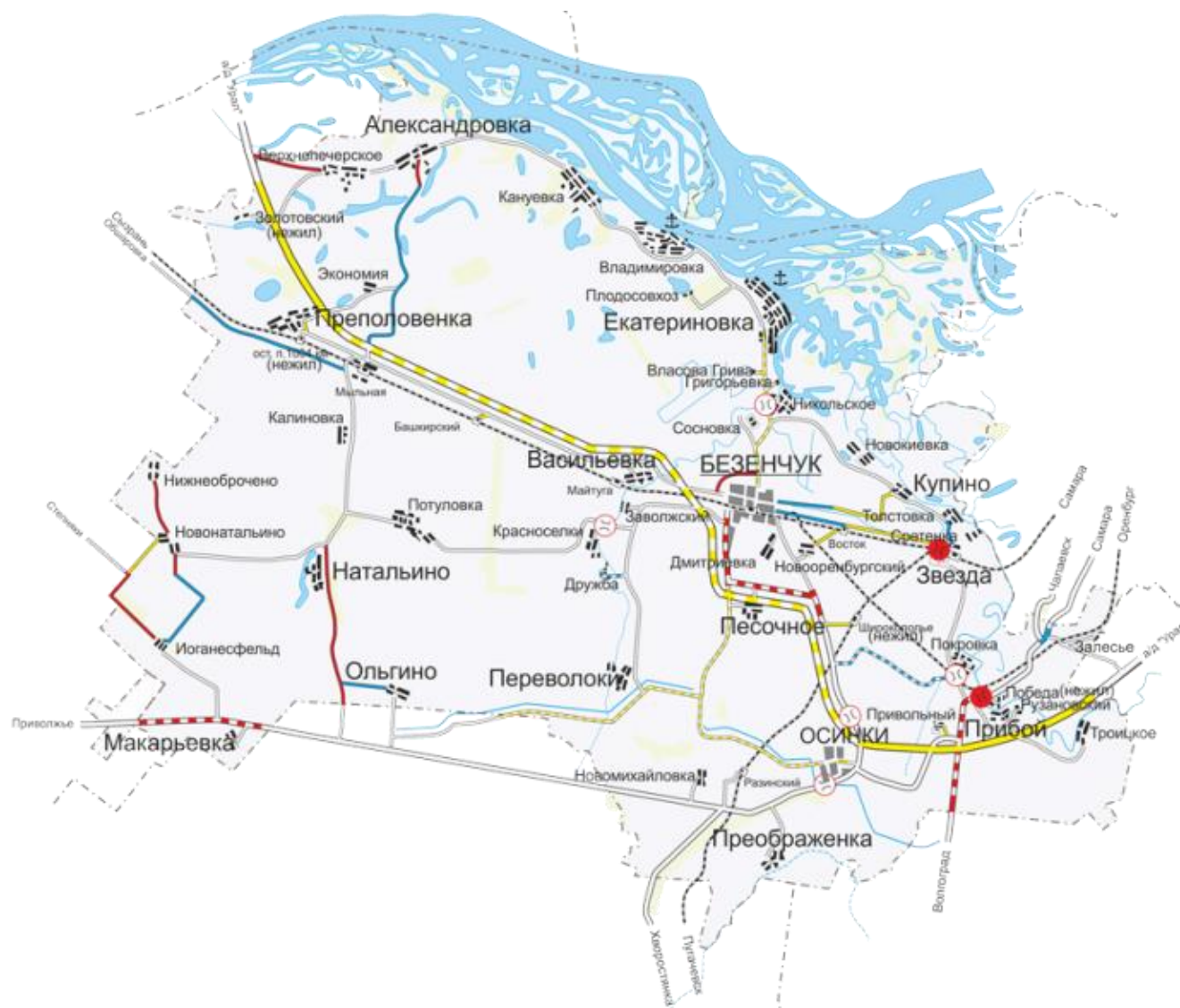
Рисунок 1 - Расположение г.п. Безенчук